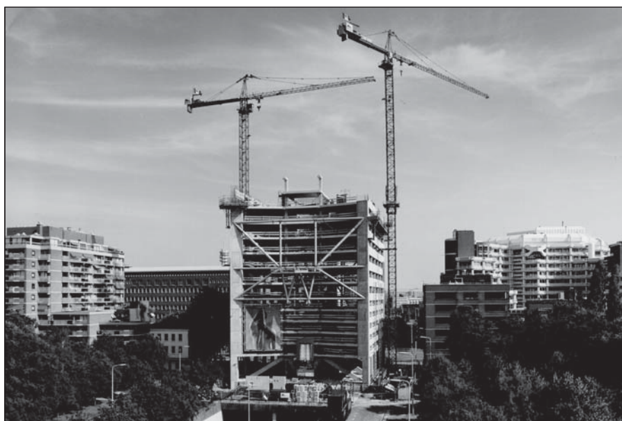
FIGUUR 2: MALIETOREN BOUWFASE (CORSMIT)