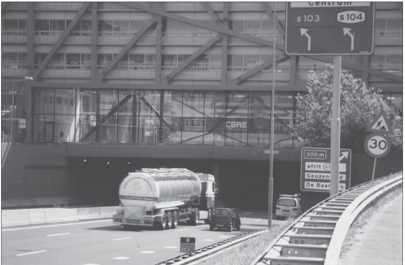
FIGUUR 1: BOS EN LOMMER

gegronde basis dan alleen op basis van de normen voor het individueel- en groepsrisico, hetgeen nu het geval is. In tabel 1 worden monetaire waarden voor een gewogen risicoanalyse weergegeven. Hierin is te zien dat bijv. een persoon bereid is om per jaar € 100,- te betalen voor een bundel van bepaalde kwaliteiten die relatie hebben met meervoudig ruimtegebruik.